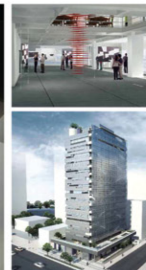
Obra Sesc Paulista

Premiação IAB-SP 2008 (Instituto de arquitetos do Brasil) Mensão Honrosa na categoria Requalificação/Restauração