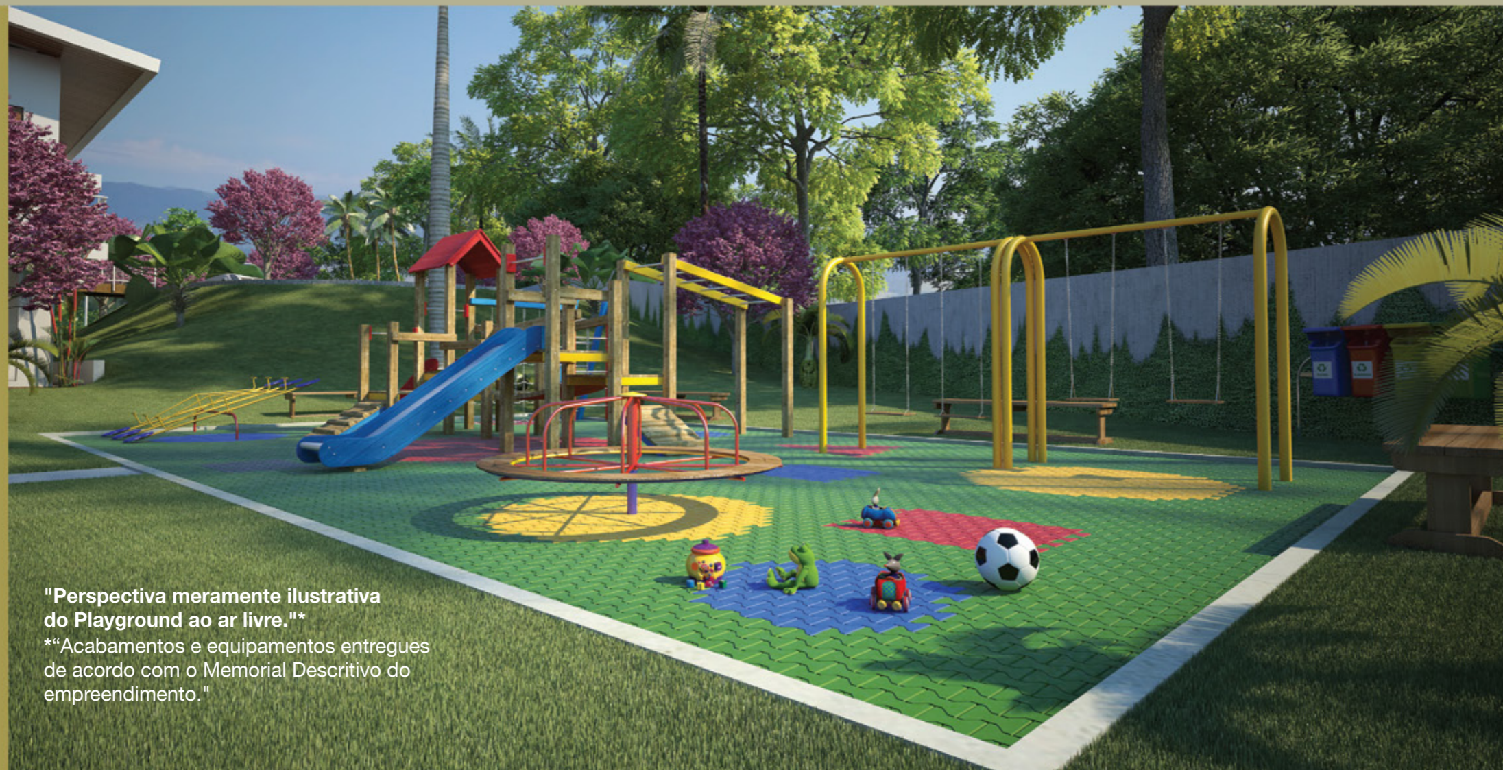
"Perspectiva meramente ilustrativa do Playground ao ar livre."*

Atividades físicas e diversão. Espaços elaborados visando o bem-estar de todas as idades.