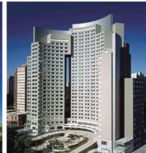
Obra Edifício "Stadium" Alphaville SP.

Premiação IAB-SP 2002 (Instituto de arquitetos do Brasil) Mensão Honrosa na categoria Edificação para Escritórios e fins Diversos