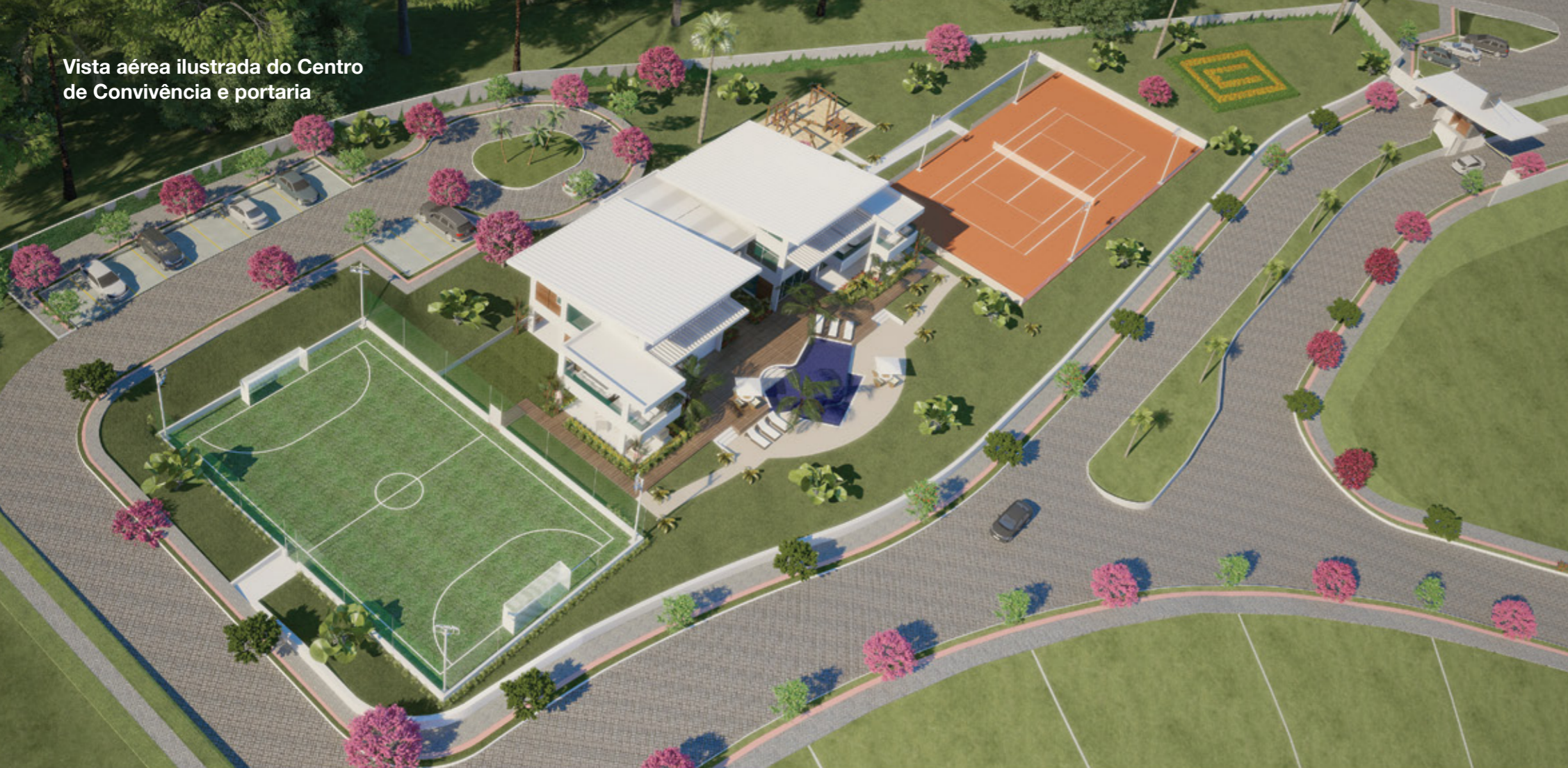
Vista aérea ilustrada do Centro de Convivência e portaria