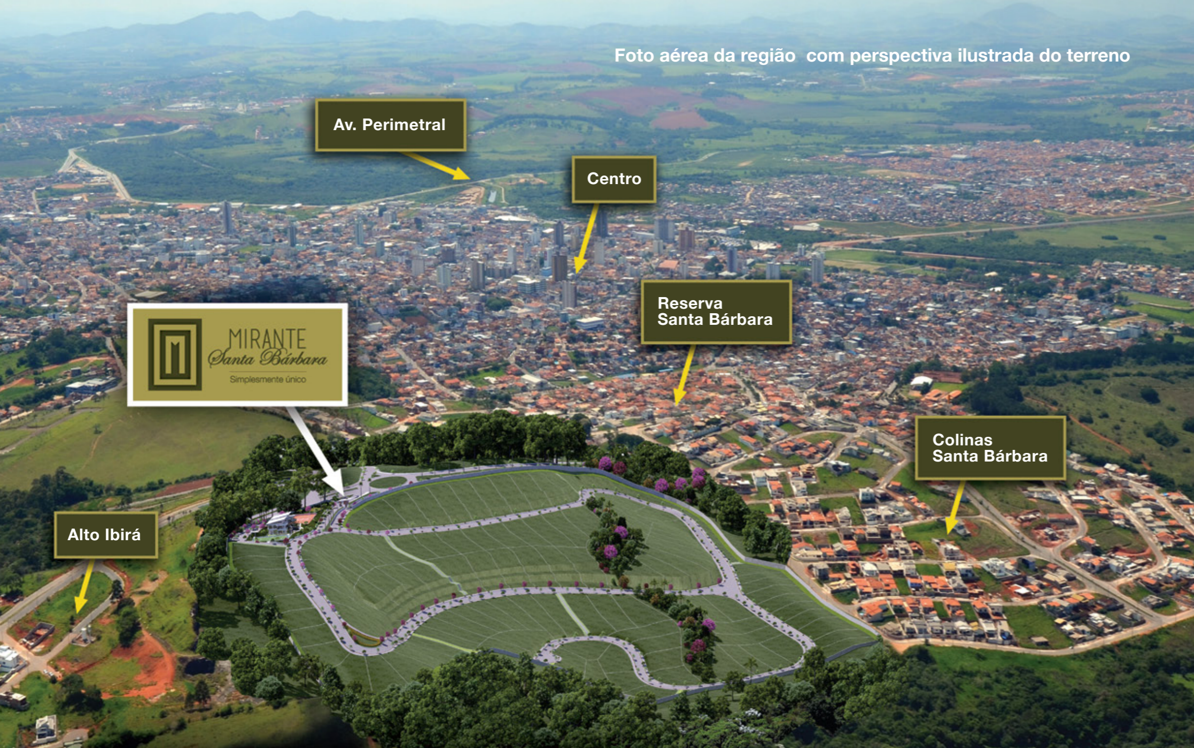
Foto aérea da região com perspectiva ilustrada do terreno

OPORTUNIDADE ÚNICA PARA QUEM GOSTA DE SER ESPECIAL.