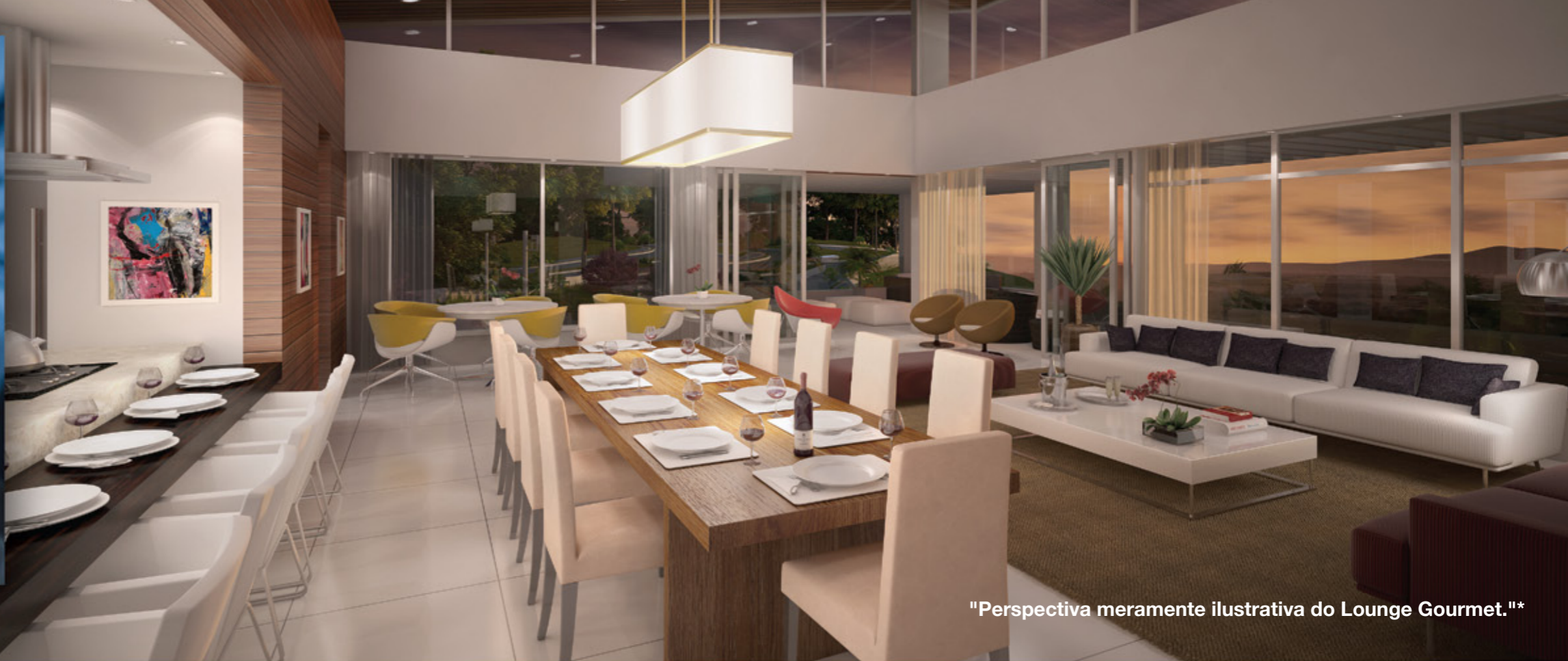
"Perspectiva meramente ilustrativa do Lounge Gourmet."*

Muitos motivos para celebrar momentos inesquecíveis. Um convite impossível de se recusar.