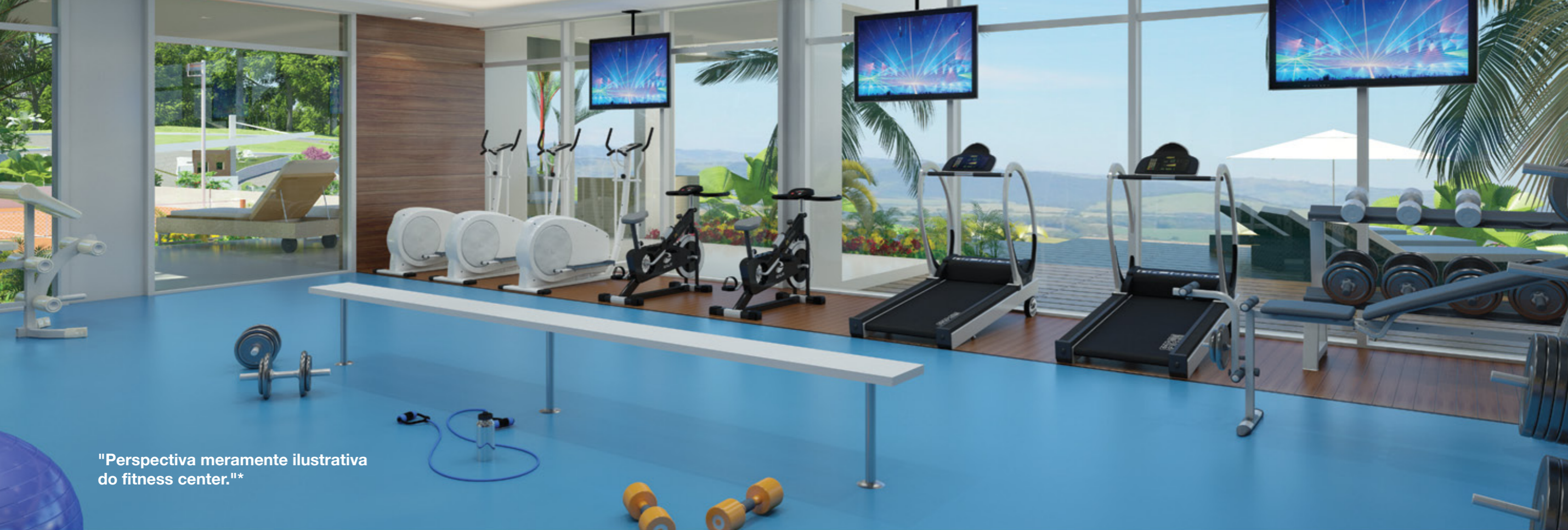
"Perspectiva meramente ilustrativa do fitness center."*

Atividades físicas e diversão. Espaços elaborados visando o bem-estar de todas as idades.