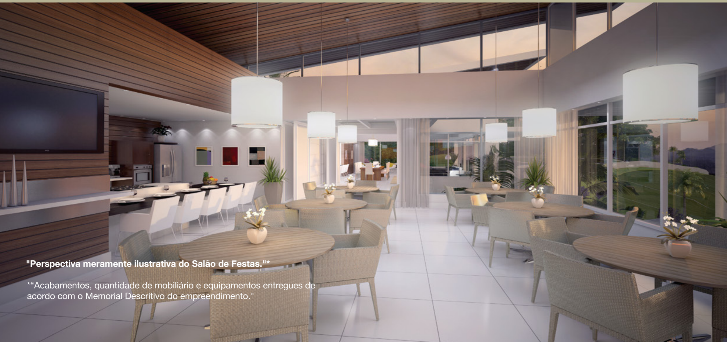
"Perspectiva meramente ilustrativa do Salão de Festas."*

Muitos motivos para celebrar momentos inesquecíveis. Um convite impossível de se recusar.